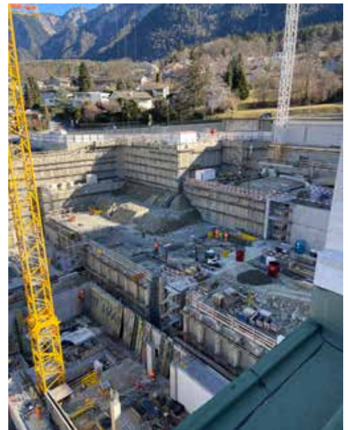
Foundation Zwischenbereich 1. Obergeschoss

Bis zum Ende des vergangenen Jahres wurden bereits ca. 6'000m 3 Beton sowie 1'100t Armierung verbaut. Ein grosser Teil davon wird später nicht mehr sichtbar sein. Das Bild aus dem 3D Modell zeigt wie das Haus von unten aussieht. Bis zur Vollendung des Rohbaus im Jahr 2024 werden wir ca. 32'000m 3 Beton verbauen.