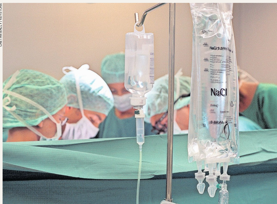
Jede dritte transplantierte Niere in der Schweiz stammt von einem Lebendspender.

Nach einer Transplantation sind Patienten zeitlebens auf Medikamente angewiesen, damit das Organ nicht abgestossen wird. Dank einem neuen Verfahren könnte sich dies ändern. In Zürich ist die erste Patientin Europas erfolgreich behandelt worden. Von Theres Lüthi