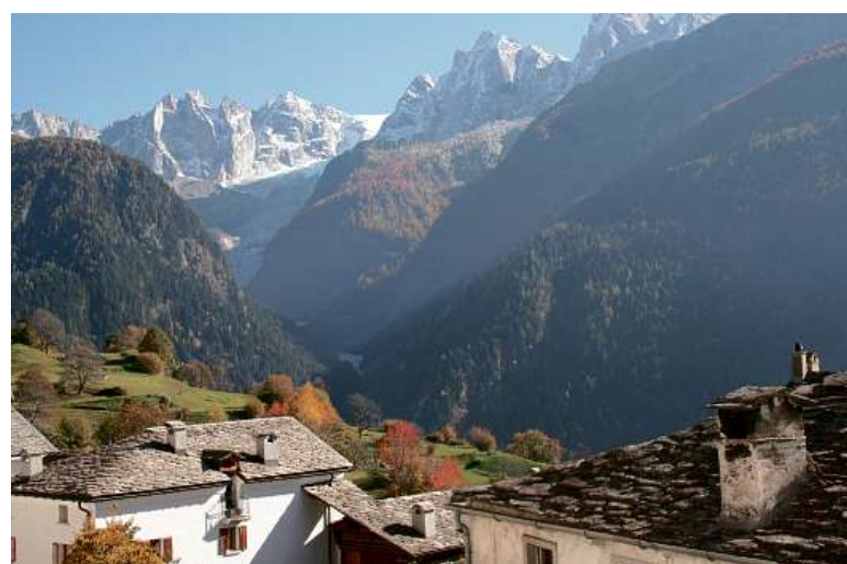
Blick aus einem der historischen Zimmer im «Palazzo Salis» in Soglio auf das Dorf und die gegenüberliegende Bergkette.