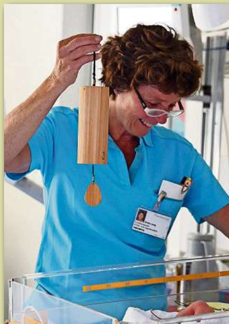
Mit verschiedenen Klängen werden die Neugeborenen bereichert.