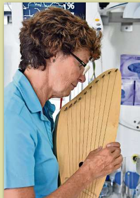
Musik und Klänge unterstützen den Genesungsprozess.