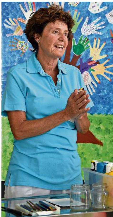
Für die Kunsttherapie steht den Patienten viel Material zur Verfügung.

weniger gefragt sind – die Pflegenden warten bereits mit ihren Aufträgen auf die Therapeutin. Die Früh- und Neugeborenen