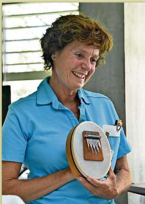
Die Kunsttherapeutin ist in ihrem Alltag mit vielen Patienten der Kinder- und Frauenklinik in Kontakt.