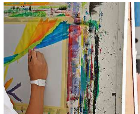
Das Malen bietet Ablenkung und fördert die Ressourcen.

Angebot künftig noch weiteren Patientengruppen zur Verfügung gestellt werden kann.»