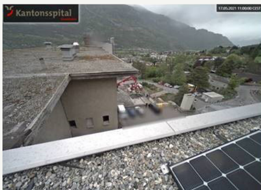
Webcam 1 Baustelle SUN