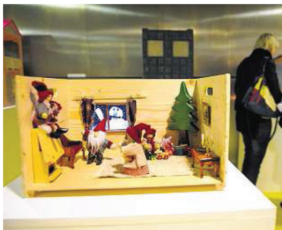
Kein Fest wie das andere: Studierende der Pädagogischen Hochschule zeigen mit selbst gestalteten Puppenhäusern wie verschieden Weihnachten sein kann.

Vielleicht, vielleicht auch nicht. Ich möchte aber doch daran erinnern, dass die langjährigen Auseinandersetzungen im Bistum Chur kein isoliertes Problem der Zürcher Kirche darstellen, sondern alle Bistumskantone betreffen und umtreibt. Die Churer Wirken haben jahrelang auch die Schweizer Bischofskonferenz und den Vatikan beschäftigt. Grundsätzlich bin ich daher der Meinung, dass sich die Spannungen beilegen lassen, wenn die Bistumsleitung allen Bistumsregionen, nicht nur der Zürcher Kirche, auf Augenhöhe begegnet, diese als Partner akzeptiert und mit ihnen einen echten Dialog pflegt. An Zürich soll es nicht liegen.