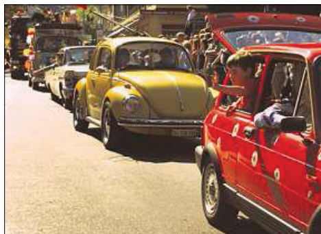
Gute Stimmung: 30 000 Schlagerfans füllten die Churer Strassen, Plätze und Bars am Wochenende.

24 Hossamobile fuhren am Samstagnachmittag durch die Churer Strassen, und am Abend sorgten Wencke Myhre und das Wilde Tiger Ensemble auf dem Arcasplatz für freudige Tanzbeine. Mit dem Umzug, den Schlagerstars wie auch der Freinacht eine grosse Organisation. Stadtpräsident Christian Boner war am Wochenende abwesend, an der Organisation des Festes jedoch ebenfalls involviert: «Die Stadt hilft bei der Schlagerparade mit der Verkehrsregelung, der Abfallentsorgung und einem Beitrag von 8000 Franken mit.» Obwohl er ortsabwesend war, habe er mitbekommen, dass das Fest an seine Kapazitätsgrenzen stosse. «Wir werden nun das Gespräch mit dem OK und zusammen nach einer Lösung suchen», so Boner. Er sei sich sicher, dass sie eine Lösung finden werden.