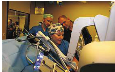
Hohe Präzision: Ein Besucher lässt sich die interaktiven Instrumentenarme des Da-Vinci-Operationssystems erklären.