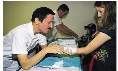
Nur zu Demonstrationszwecken? Im Zentralen Notfall haben sich vor allem Schüler gern mal einen Arm eingipfen lassen...