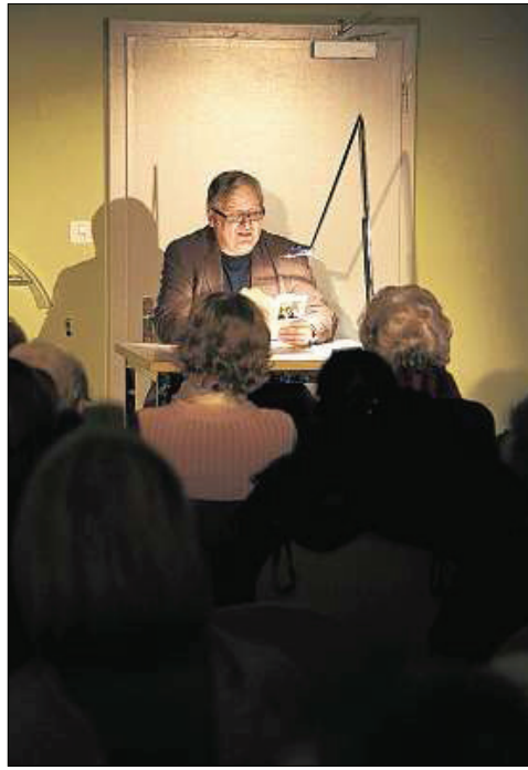
Im schummrigen Licht des Bunkers entsteht die perfekte Atmosphäre für Dürrenmatts «Science Fiction».

Dabei seien die ansonsten für Besucher nicht zugänglichen Luftschutzbunker des Spitals für Zogg genau die richtige Kulisse für diesen Text, denn auch in der Geschichte Dürrenmatts befindet sich die gesamte Regierung während dieses Dritten Weltkriegs in