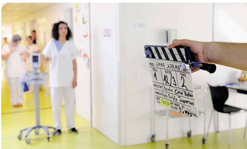
Die weiteren Hauptdarsteller/-innen im Video: Pflegende in Ausbildung ...