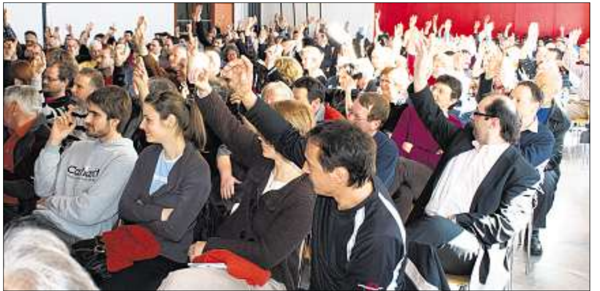
Viel Zustimmung zum Vorhaben des Kantons, dem Albulatal Hilfestellung bei der Lösung seiner Strukturprobleme anzubieten.