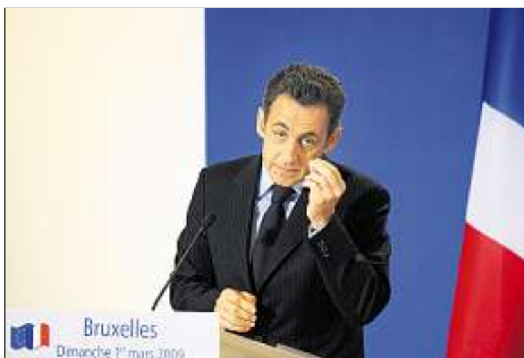
Der französische Präsident Nicolas Sarkozy drohte der Schweiz gestern in Brüssel mit der schwarzen Liste der Steueroasen. (Ky)